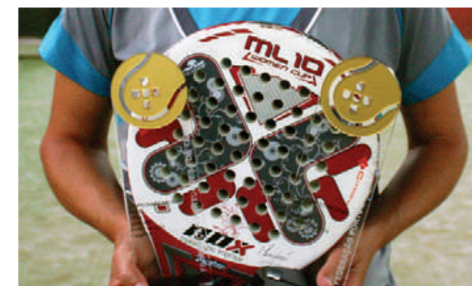
Troféus de campeã nacional Padel em pares femininos e pares mistos ano 2013

O principal é mesmo aparecer e experimentar. Depois de jogar a primeira vez, vai querer voltar! E claro, é importante inscrever-se em aulas para aprender, praticar e evoluir.