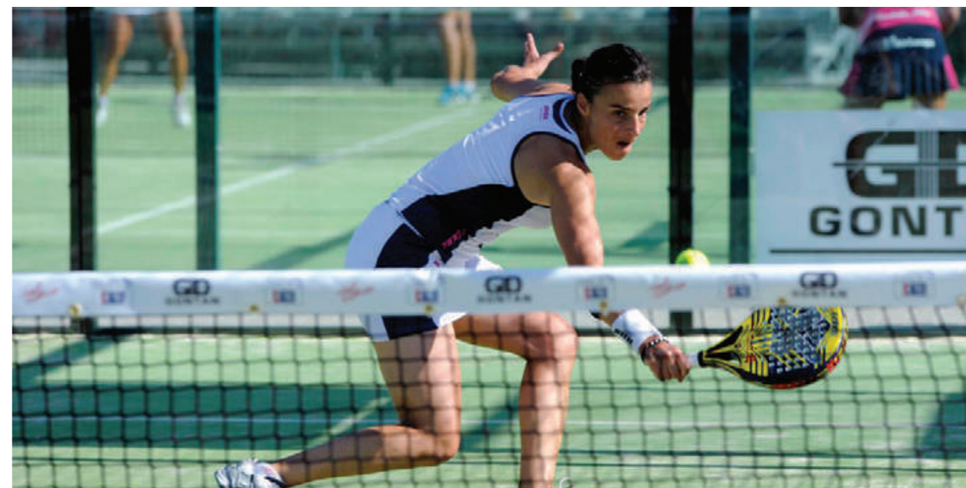
Jogo dos 1/8 final do WPT de Málaga em Julho 2014.